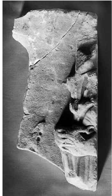
Fig. 10. Fragmento de frente de sarcófago procedente de Carmona.

Puede resultar llamativo que la mayoría de los casos se encuentren en la ciudad de Córdoba, aunque podría argumentarse que, en términos estadísticos,