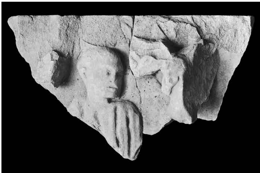
Fig. 8. Fragmento de sarcófago cristiano procedente de Madinat al-Zahra.

La característica común a todos los casos de mutilación intencionada es la decapitación o eliminación de los rostros de los personajes figurados, que generalmente no afecta al resto de las figuras. Esta mutilación parcial podría favorecer la hipótesis de un cierto “pudor” iconoclasta, aunque no particularmente riguroso. En relación con esto, un hecho que todavía no ha sido explicado completa y satisfactoriamente es la existencia de piezas mutiladas en las que algunas de las figuras no han sufrido ningún tipo de daño (fig. 8). Resulta indicativo que todos los casos de cabezas conservadas correspondan a figuras secundarias en bajorrelieve, lo que ha llevado a ver en este hecho un interés por evitar destrozar el bloque de mármol 24 . Del mismo modo que el ataque concreto a las cabezas de las figuras, este tipo de mutilación incompleta no