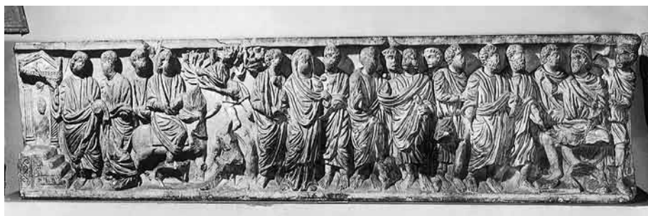
Fig. 2. Vista general del sarcófago cristiano de Berja.

Un excepcional precedente a este coleccionismo anticuario es el conjunto de sarcófagos hallados en las ruinas del palacio califal de Madinat al-Zahra. Durante su breve existencia, el conjunto palatino fue decorado con objetos antiguos y sarcófagos, seguramente procedentes de las necrópolis cordobesas. Posiblemente, la mayoría de estos sarcófagos fueron utilizados como piletas de fuente, como evidencian los numerosos retalles documentados en los fragmentos existentes, correspondientes a la apertura de agujeros de desagüe y vertederos de agua. Estas piezas fueron destruidas, junto al resto del conjunto palatino, bien durante la revuelta berebere de 1010 o bien a raíz del emplazamiento en las ruinas de la ciudad de un enclave militar en época almohade 15 .