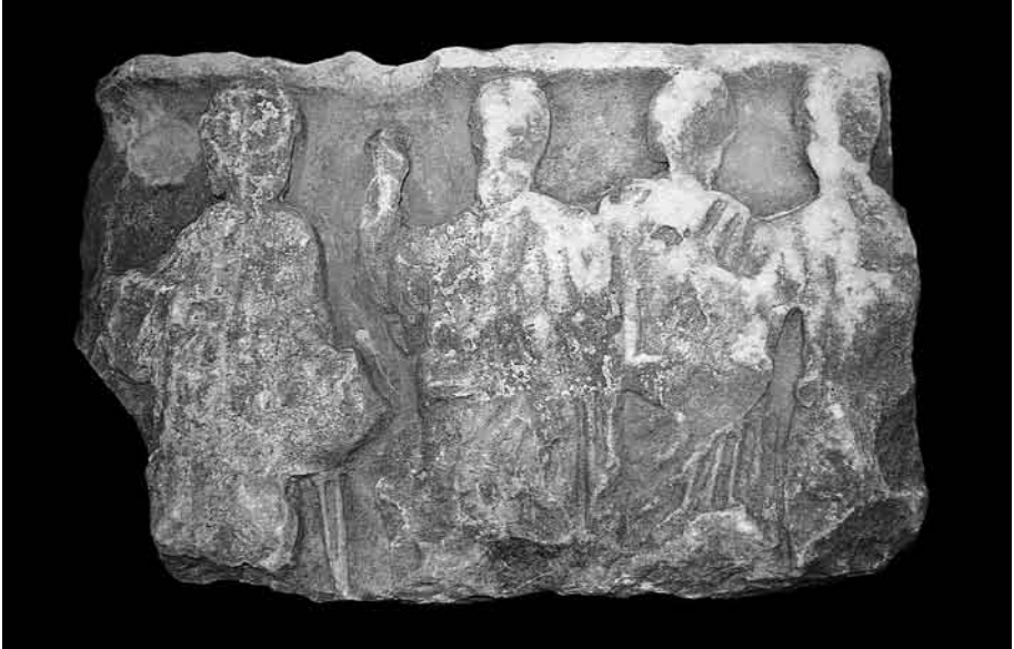
Fig. 5. Frente del sarcófago cristiano hallado en las cercanías del palatium de Cercadilla.

interesante del hallazgo consiste en el hecho de que la lastra fue colocada con la decoración hacia arriba, probablemente con la intención de pisar las figuras, mientras que, lógicamente, hubiera sido más útil disponerla al contrario con la cara posterior, perfectamente alisada, hacia arriba (fig. 6). Este hecho indicaría