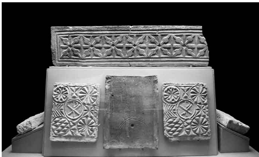
Fig. 3. Decoración biselada visigoda retallada sobre la pared posterior del frente de sarcófago cristiano de la mezquita de Córdoba (foto del autor).