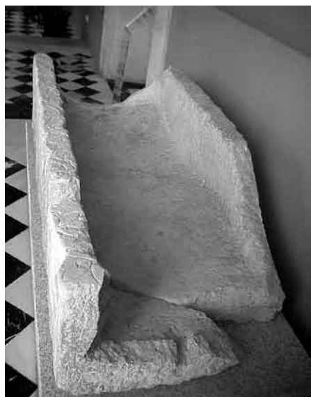
Fig. 7. Vista del interior del denominado sarcófago de La Peñuela.

Finalmente, la utilización de sarcófagos como material de acarreo se encuentra atestiguada nuevamente en el fragmento de frente de sarcófago de la mezquita de Córdoba. Debido a una segunda reutilización, este fue encontrado bajo una de las columnas del edificio, formando parte de su cimentación 18 . La mencionada ausencia de contextos estratigráficos concretos impide determinar si el conjunto de fragmentos de los que se desconocen las circunstancias precisas de hallazgo, y que componen la mayor parte de las piezas conocidas,