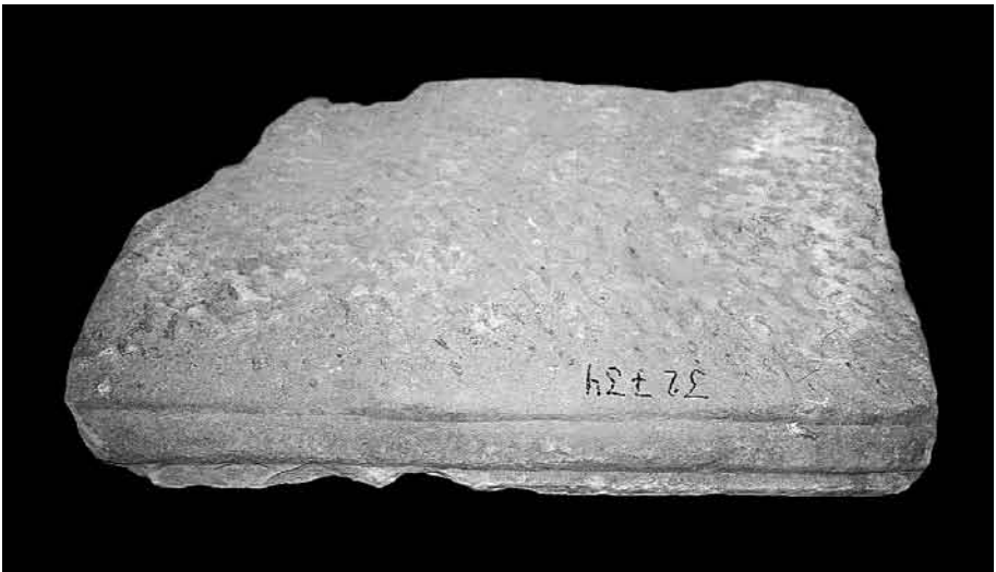
Fig. 6. Vista posterior del frente de sarcófago cristiano hallado en las cercanías del palatium de Cercadilla.

interesante del hallazgo consiste en el hecho de que la lastra fue colocada con la decoración hacia arriba, probablemente con la intención de pisar las figuras, mientras que, lógicamente, hubiera sido más útil disponerla al contrario con la cara posterior, perfectamente alisada, hacia arriba (fig. 6). Este hecho indicaría