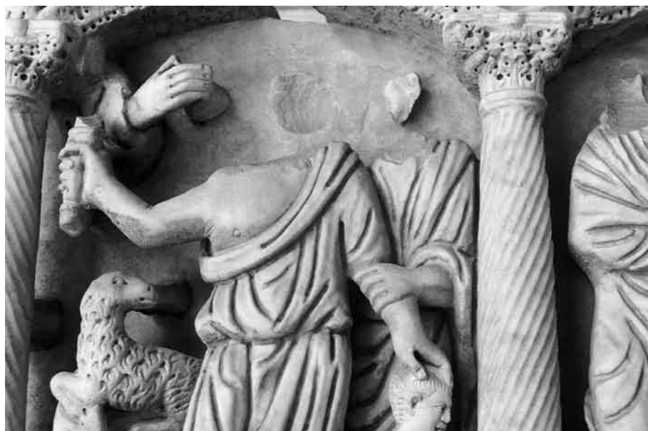
Fig. 9. Detalle del frente del denominado sarcófago de Huerta de San Rafael.

Un último aspecto que resulta especialmente interesante en esta caja de sarcófago es el carácter parcial de la mutilación de las cabezas de los personajes. A pesar de que el altorrelieve en el que se encuentran esculpidas las escenas de los intercolumnios facilitaría una destrucción casi total, esta no se llevó a cabo y