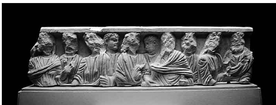
Fig. 4. Frente del sarcófago cristiano de la mezquita de Córdoba.

la lastra, presenta mutilados los rostros de las figuras del primer plano, conservando la cabeza intacta los dos personajes esculpidos en bajorrelieve del segundo plano (fig.4).