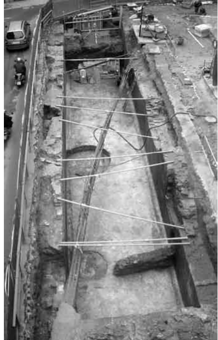
Fig. 2. Vista general del área de excavación en extensión correspondiente a la mitad norte de la nave oriental de la cisterna.

La excavación en extensión de la nave oriental de la cisterna se ha desarrollado en un área de 227 m 2 , que corresponde aproximadamente a la mitad de su superficie total, encontrándose la mitad sur bajo la calzada de Cuesta del Rosario y la línea de edificios adyacentes (fig. 2). Esta restitución hipotética está basada en la identificación del vano de comunicación situado al S del área excavada como parte de uno de los ejes del edificio, considerando un trazado simétrico de la planta del mismo. De este modo, la dimensión total de la cisterna sería de 45 metros de largo y 20,7 metros de ancho, midiendo cada una de las naves 41 metros de longitud y 5 metros de anchura 7 (fig.3).