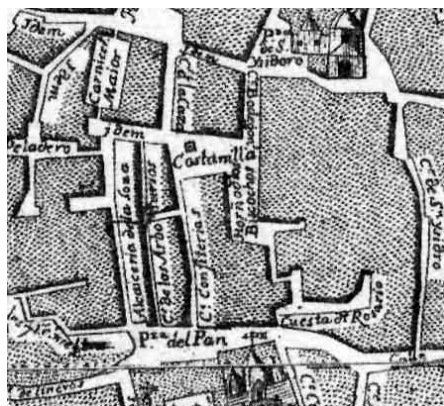
Fig. 10. Detalle del sector en el Plano de Olavide.

La principal duda suscitada para este periodo es el hecho de que, si bien el plano de Olavide presenta una plaza de fisonomía muy similar a la actual Plaza de la Pescadería, los restos de pozos y cimentaciones hacen plantear un urbanismo significativamente diverso (fig. 10). Para el caso de los pozos de agua situados en el centro y extremo norte de la nave excavada pudiera plantearse tanto la posibilidad de que fuesen parte de una estructura anterior al siglo XVIII como que se encontraran situados en