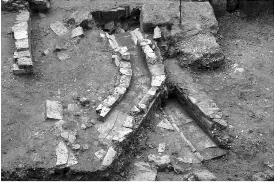
Fig. 6. Detalle de las estructuras de canalización relacionadas a actividades de tipo industrial.

establece un punto de referencia en la delimitación de la ciudad republicana y su recinto amurallado.