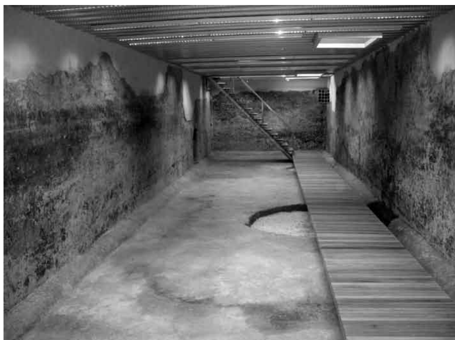
Fig. 1. Estado actual de la nave oriental del castellum aquae tras las labores de cubrimiento y restauración.

La importancia del hallazgo motivó la continuación de las labores arqueológicas con el fin de delimitar el perímetro de la estructura, permitiendo de tal modo valorar la posibilidad de su excavación íntegra 5 . Pudo observarse que la mayor parte los elementos verticales del edificio se encontraban inmediatamente situados bajo el asiento de preparación del pavimento de la actual plaza, lo que hacía suponer un estado de conservación excepcional de los restos arquitectónicos subyacentes. Ante estas circunstancias se planteó la posibilidad de excavar en extensión parte de una de las naves del edificio, en concreto la localizada durante la realización del sondeo estratigráfico inicial. Esta excavación permitió, por una parte, documentar algunos de los elementos de la estructura que no habían sido registrados con la realización de los sondeos, como el muro exterior N y dos puertas de comunicación internas, y por otro lado la puesta en valor de los restos mediante la modificación del proyecto de obra civil que ha incluido el cerramiento del área excavada y la creación de un acceso para posibilitar futuras visitas 6 (fig. 1).