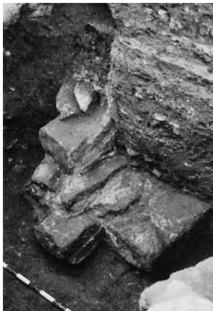
Fig. 5. Monumento funerario tardorrepublicano. Pueden apreciarse en el perfil los estratos de preparación del terreno correspondientes a la operación urbanística de época julio-claudia y la zanja de cimentación de la cisterna.

En el mismo sondeo al que se ha hecho mención en relación con los niveles prerromanos se localizó un pequeño monumento funerario de planta cruciforme y perfil escalonado 15 (fig. 5). Se encuentra realizado en pequeños bloques de piedra y sillarejo, conservando parcialmente un revestimiento de mortero de cal. Su estado de conservación no es muy bueno, ya que perdió parte de su base durante la excavación de la zanja de cimentación de la cisterna 16 . Su base se encontraba cubierta por un estrato de tierra limpia de matriz arcillosa y cenizas. El intenso color rojizo que presentaba el estrato está motivado indudablemente por la acción del fuego, lo que pudiera ser interpretado por la presencia cercana de un ustrinum . Esta hipótesis está refrendada por el registro material del