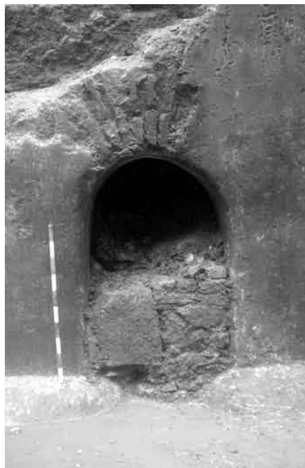
Fig. 4. Detalle del vano de comunicación norte. La amortización del acceso corresponde a la fase de reocupación de la estructura tras su inutilización. Puede apreciarse igualmente el robo de ladrillos correspondiente a una zanja de saqueo almohade.

No se han conservado restos de las cubiertas de las naves, aunque con gran probabilidad pudieron haber sido bóvedas de medio cañón. Al no quedar siquiera resto alguno del arranque de éstas, no es posible determinar con