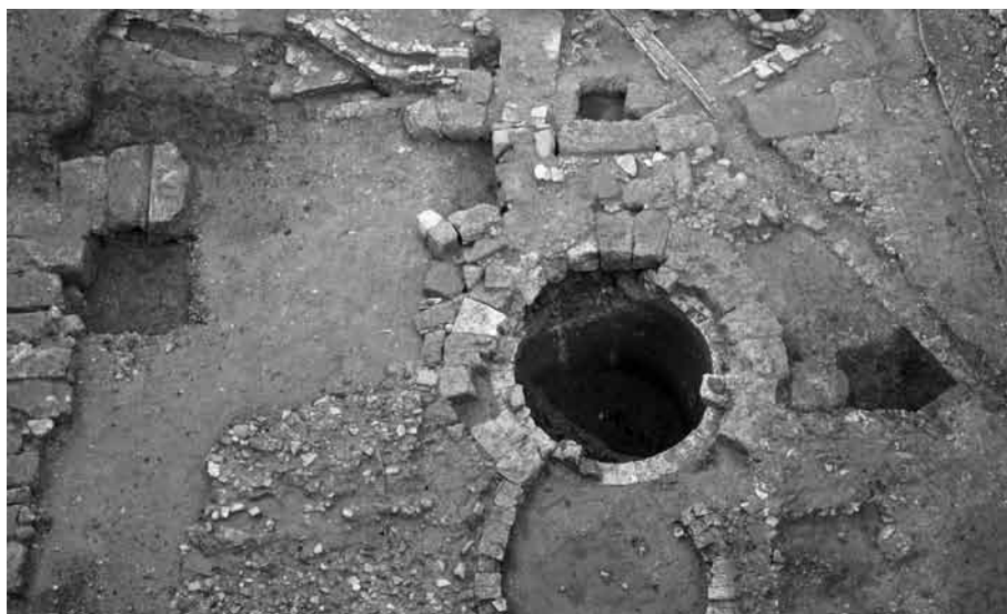
Fig. 7. Vista general del edificio que ocupa el sector occidental de la plaza.

La primera fase puede datarse genéricamente en el siglo I d.C. y a ella pertenece el muro E al que se asocia una preparación de pavimento y un gran pozo de agua. Este pozo está realizado en ladrillo aunque conserva en su perfil superior una hilada de bloque de piedra de los que arrancan cuatro nervios. Este elemento pudiera ser interpretado como parte de un cubrimiento abovedado de características indeterminadas. En el siglo II d.C. el edificio se amplía hacia el N con un nuevo muro de cierre y una nueva preparación para pavimento. Es significativo el hecho de que precisamente en este momento, que coincide con la construcción de la cisterna, se amortiza definitivamente el pozo de agua.