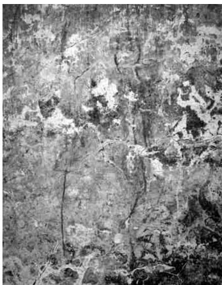
Fig. 8. Detalle de uno de los grafittis tardoantiguos.

La presencia de varios grafittis realizados con carbón en la zona baja de la pared W de la nave excavada, así como de un muro que cerraba el extremo N de la misma, permiten pensar que en un momento previo a la destrucción de las bóvedas y posterior a la interrupción del suministro