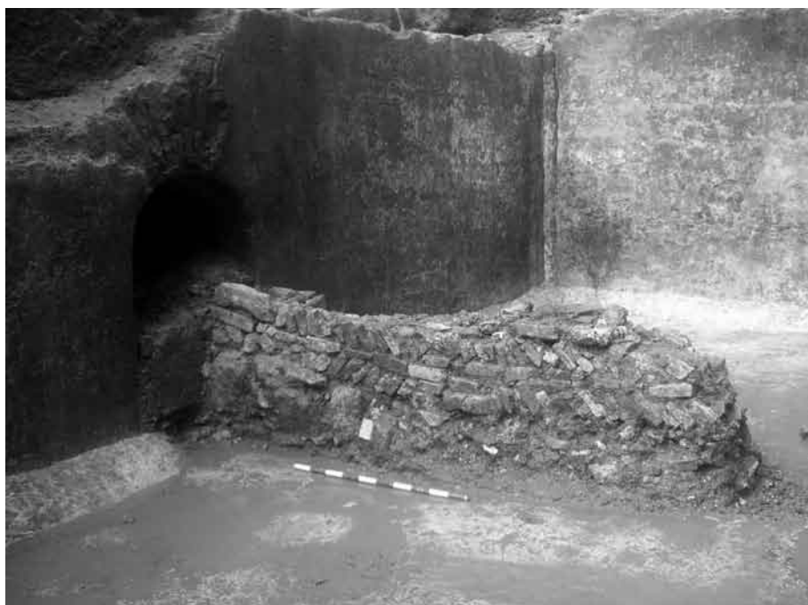
Fig. 9. Muro tardoantiguo correspondiente a la reocupación de parte de la cisterna.

Al contrario, en el extremo norte de la nave se documenta una reocupación del espacio mediante la construcción de un muro transversal realizado en una variante tardía del opus listatum (fig. 9). La funcionalidad de este espacio no