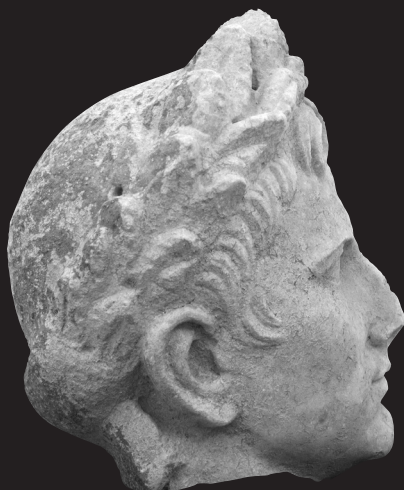
Fig. 8. Retrato de Augusto de Torreparedones (Baena, Córdoba). Vista lateral. Museo Histórico de Baena (Córdoba)