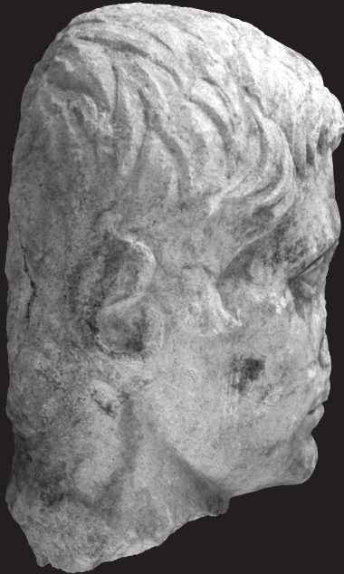
Fig. 2. Retrato de Augusto. Vista lateral. Museo Arqueológico Provincial de Córdoba.