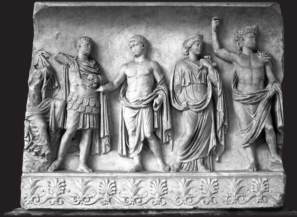
Fig. 12. Relieve de Rávena.