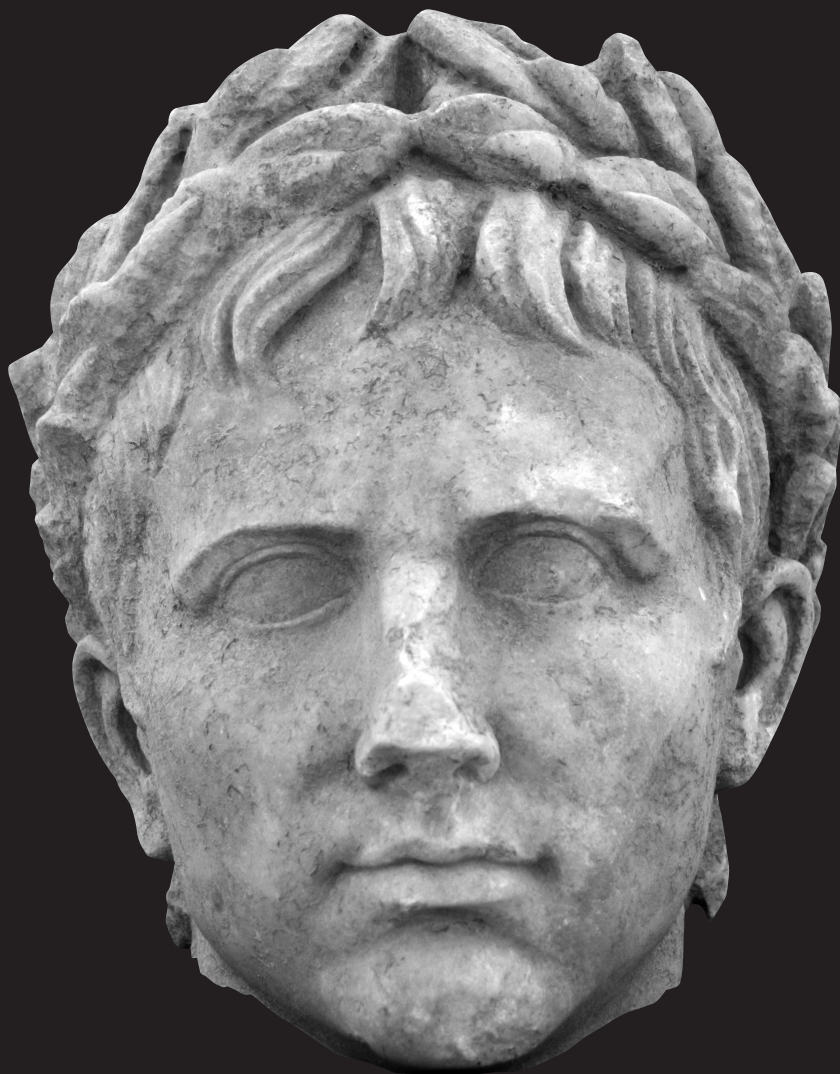
Fig. 6. Retrato de Augusto de Torreparedones (Baena, Córdoba). Vía frontal. Museo Histórico de Baena (Córdoba)