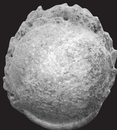
Fig. 9. Retrato de Augusto de Torreparedones (Baena, Córdoba). Museo Histórico de Baena (Córdoba)