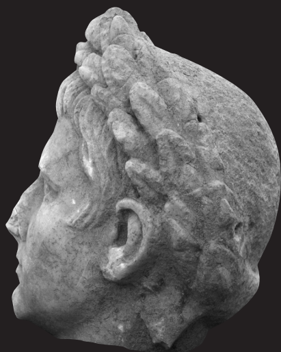
Fig. 7. Retrato de Augusto de Torreparedones (Baena, Córdoba). Vista lateral. Museo Histórico de Baena (Córdoba) Foto: autor.