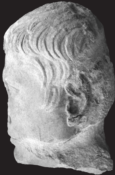
Fig. 3. Retrato de Augusto. Vista lateral. Museo Arqueológico Provincial de Córdoba.