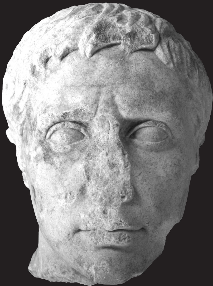
Fig. 1. Retrato de Augusto de Montemayor. Vista frontal. Montemayor. Museo Arqueológico Provincial de Córdoba.