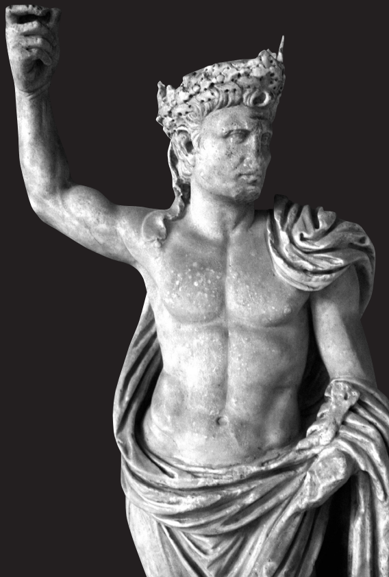
Fig. 13. Detalle de Augusto. Relieve de Rávena.