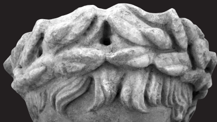
Fig. 10. Retrato de Augusto de Torreparedones (Baena, Córdoba). Detalle del peinado y la corona. Museo Histórico de Baena (Córdoba)