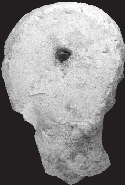
Fig. 4. Retrato de Augusto. Vista zona occipital con huella de perno. Museo Arqueológico Provincial de Córdoba.