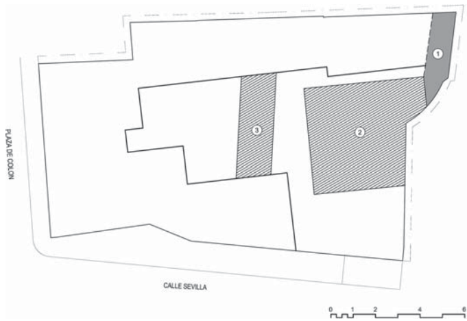
Figura 2. (a) A la izquierda, planta de los restos del sistema defensivo documentados en la parcela. (b) Abajo, vista general de las estructuras defensivas excavadas.