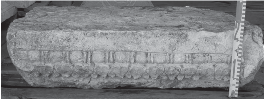
Figura 3. Cornisa romana reutilizada como cubierta de una tubería contemporánea.

de perlas redondeadas y cuentas bicónicas, que no guarda relación axial con el motivo decorativo del siguiente registro. A continuación y sobre una cima reversa se ha dispuesto un motivo de hojas acorazonadas con el nervio central resaltado y lancetas entre las mismas. Se define como un Blattkymation vegetalizado que está decorado con lancetas intermedias.