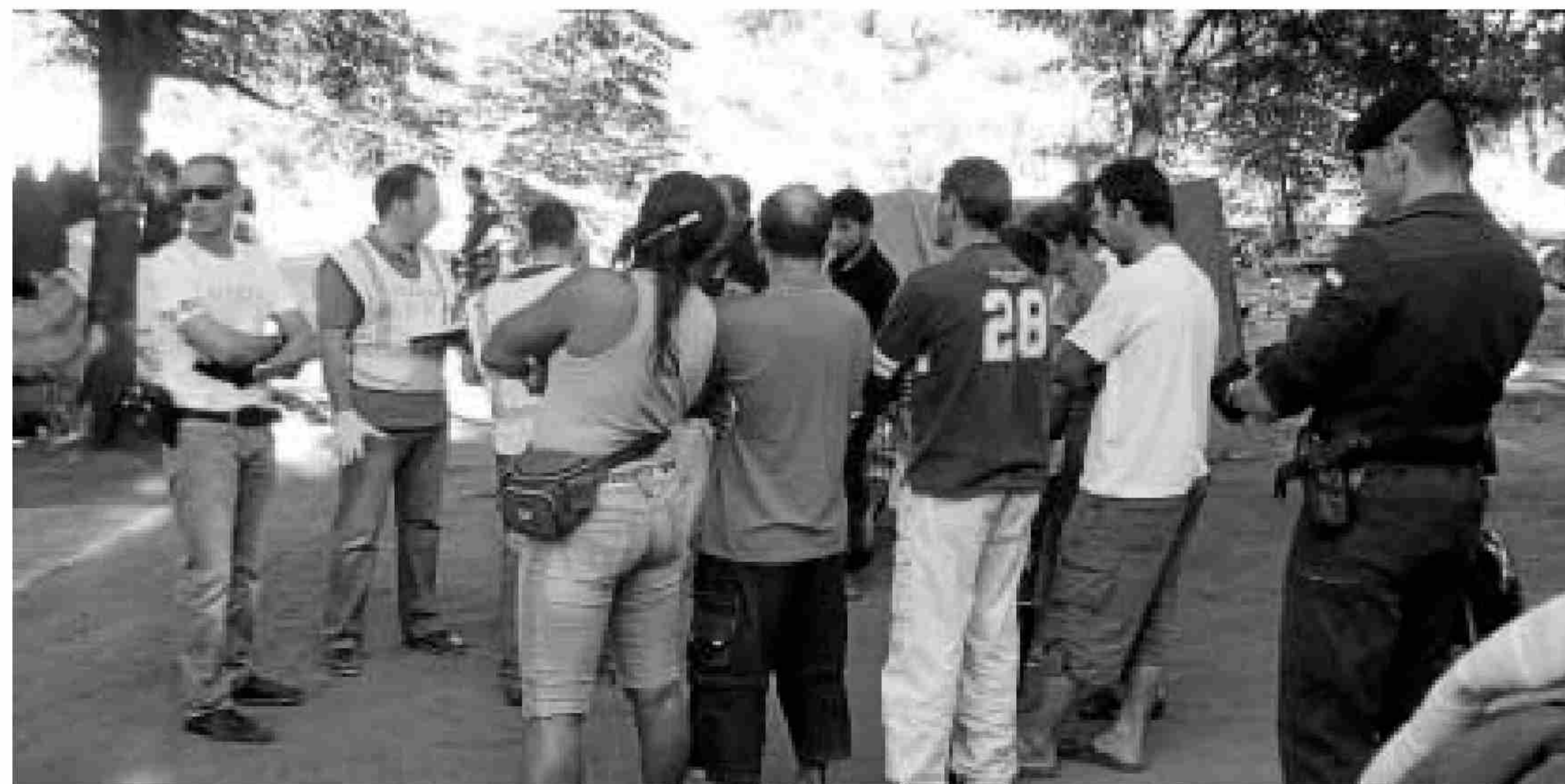
La Guardia Civil procede al registro de las chabolas del Charco de la Pava. D. S.